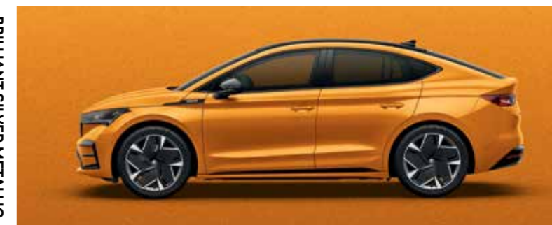
PHOENIX ORANGE METALLIC