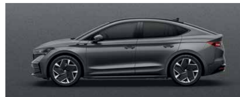
GRAPHITE GREY METALLIC