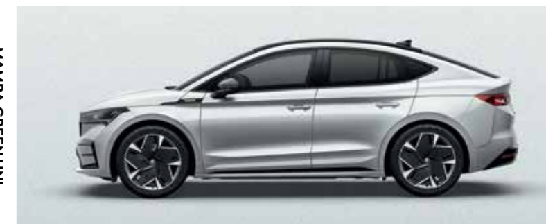
MOON WHITE METALLIC