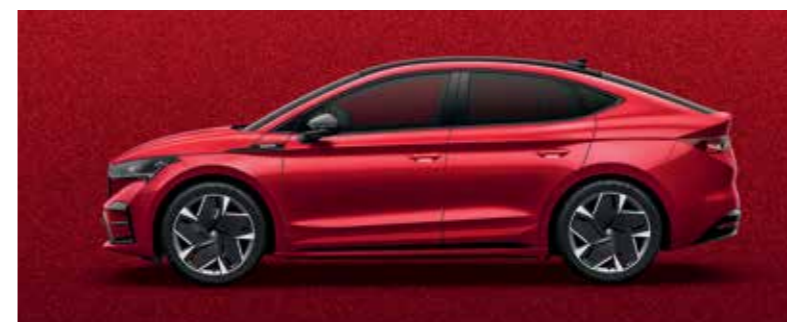
VELVET RED METALLIC