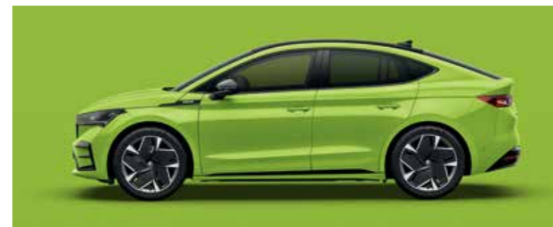
MAMBA GREEN UNI