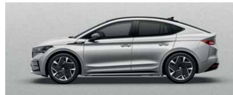
BRILLIANT SILVER METALLIC